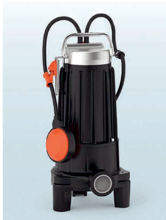
TABLA DE PRESTACIONES 2.900 rpm

Los modelos monofásicos con cuadro con salvamotor, y condensadores de arranque y funcionamiento.