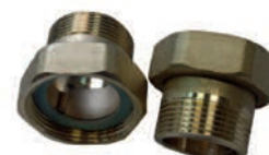
F/O - M/O