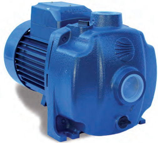
TABLA DE PRESTACIONES

MOTOR ELÉCTRICO: Con ventilación externa y apto para servicio continuo, con protección IP44 y aislamiento clase F MOTOR monofásico con salvamotor térmico incorporado. Trifásico en clase IE2 (IEC 60034-30)